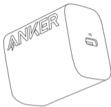
Anker 20W USB-C Wall Charger USER MANUAL