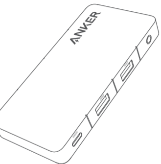
Anker 343 USB-C Hub (7-in-1, Dual 4K HDMI)