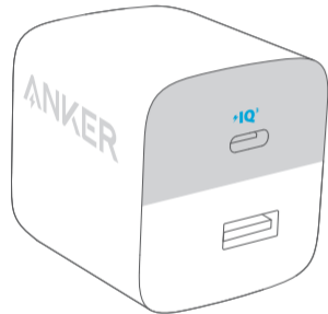
Anker 323 Charger (33W)